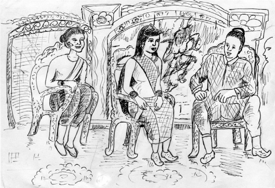
អន់តិត ឡើង ណោះ ឡាក កេះ កាម៉ាញ់ សាដាច់ ហង ។

សាដាច់ ប៉ាកះ រះ កា ពូ ជា " វែង ៣០ ដាវ ណាវ ប៉ាញ់សង់ ហង " ។ សាដាច់ អន់ ៣០ ដាវ ភ្លើ បុច កា អុះ មី ឡើង ស្រុក ចាំងហាយ តាន់ ឡាំ អែត ប៉ាញ់សង់ អន់ខ្មែ ដេល ។ សារ ចឹង ប៉ាញ់សង់ ឡាក លូ សាដាច់ ណោះ កាតាំង លៅ ទីល ប៉ាត់ កាំ លូ មើត អែ ។ អន់ខ្មែ កាតាំង បុច អិត កា ឡាក ខាក់ ឡើន បុច ប៉ាន់តៅ អ្នាត ជា អន់ខ្មែ អ្ន ប្រើត ទី ។