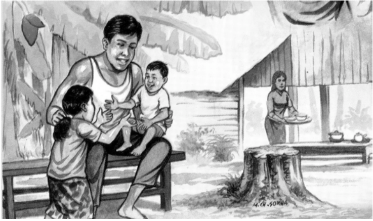
ម៉ារ អន់ឡូ កាណុង ខាប់ខ្លួន ។