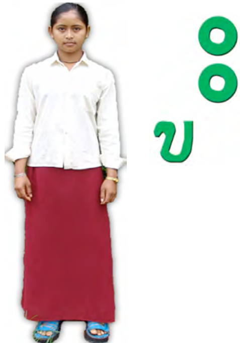
ស៊ី ៖ ក្រមុំ