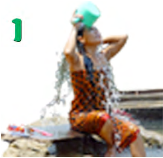
ហុំ ងូតទឹក