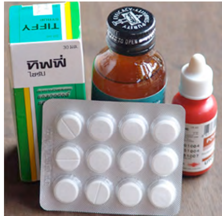
អន់ហ្គាំ ថ្នាំ