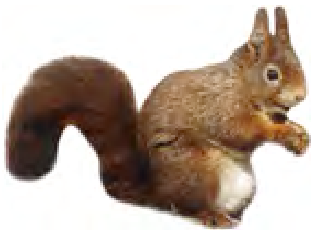
ព្រាក កំប្រុក