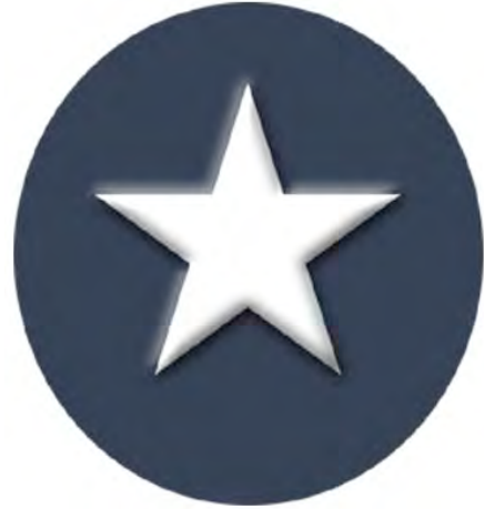
សំឡឹង ផ្កាយ