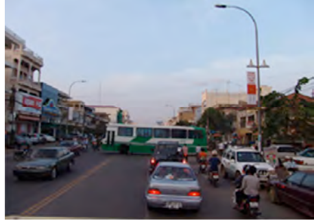
ម៉ឺង ទីក្រុង