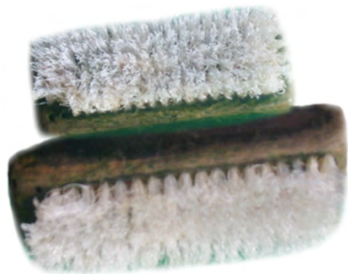
ច្រេះ ច្រាស