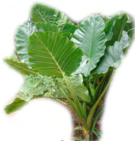
កង ក្អាតច្រៃ