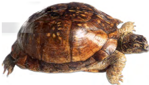
គប អណ្តើក