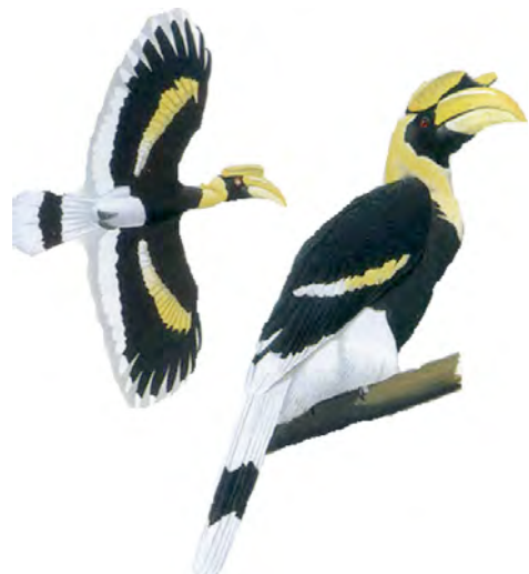
ក្រែង កេងកង