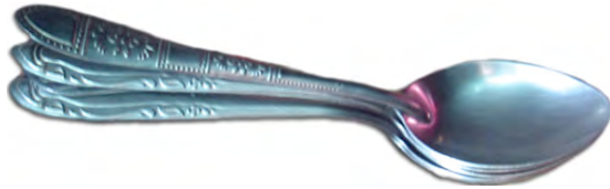
ប្លង់ ស្នាបព្រា