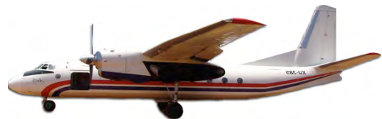
នន យន្តហោះ