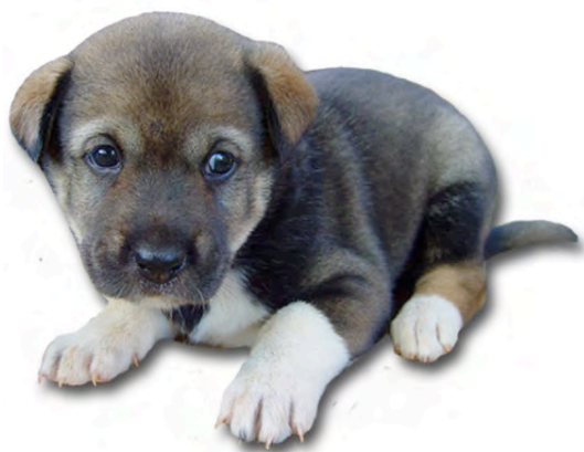
ស្នូ ឆ្កែ