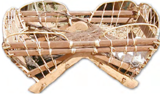
ងង កូបដាក់លើខ្នងដំរី