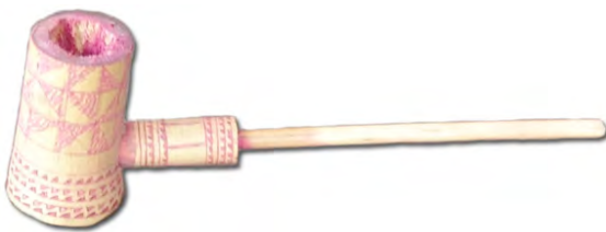
តាំង ខ្សៀ