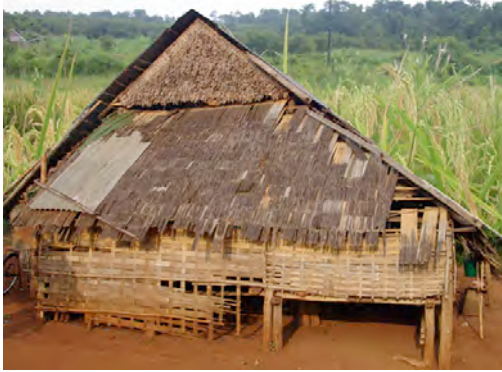
ប៊ែក ខ្នងចំការ