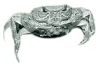
កិ កូនក្តាម