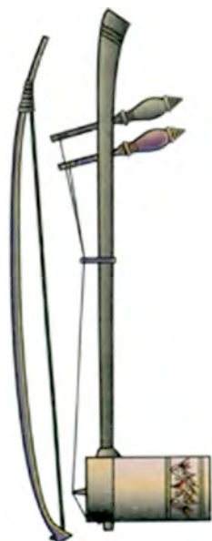
ស្រែ ទ្រសោ