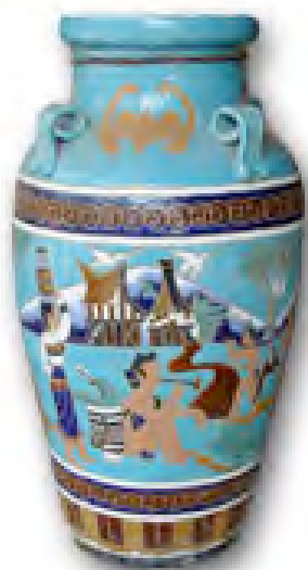
ព្រឺយ ពាងស្រា