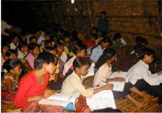
ស៊ី ៖ សិស្ស