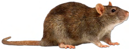
រ៉ាវ កណ្តុរ