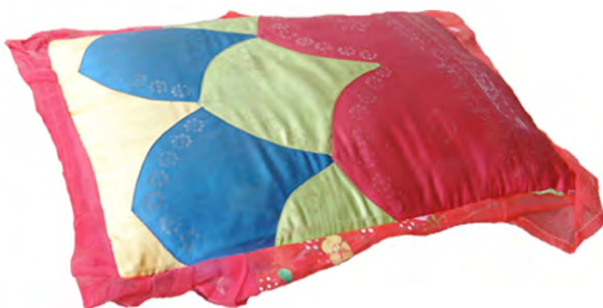
កាន់ហ្គើយ ខ្លើយ