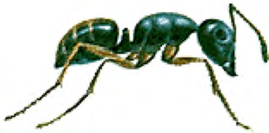
អំប្លោច ស្រមោច