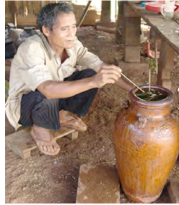
ស៊ី ៖ តារាង ឧបកិច្ច