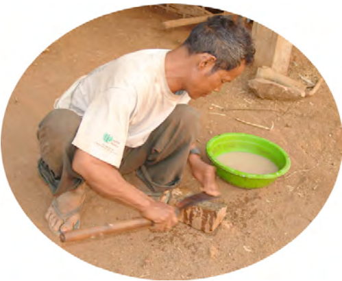
ធ្មង ធំល្បែង