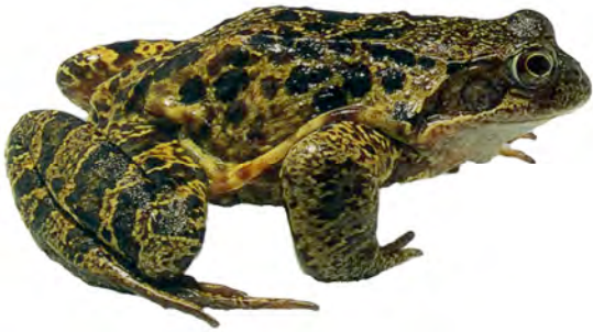
ក៏ត កង្កែប