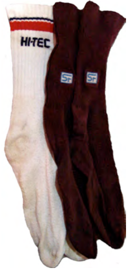
ថាំងថៅ ត្រៀមជើង