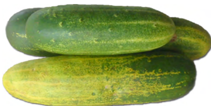
ប៊ូរា ត្រសក់