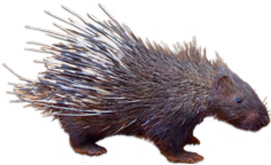
ស៊ែ សត្វប្រមា