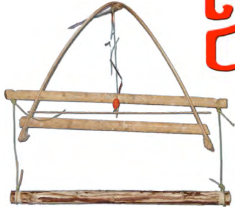
ខ្សែ អង្កប់ដាក់សត្វស្លាប