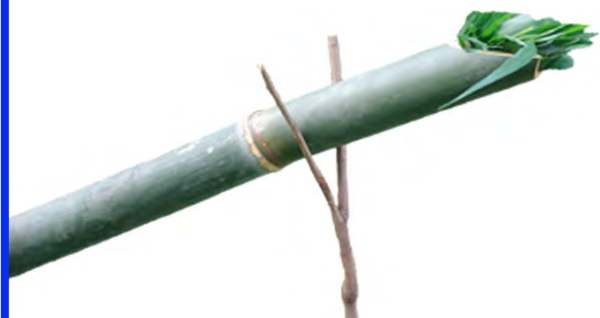
តវ បំពង់ដាក់ទឹក