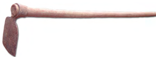
ថ្មុក ចបកាប់