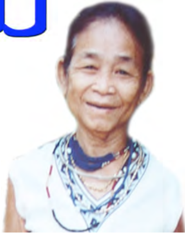
យ៉ាត់ យាយ