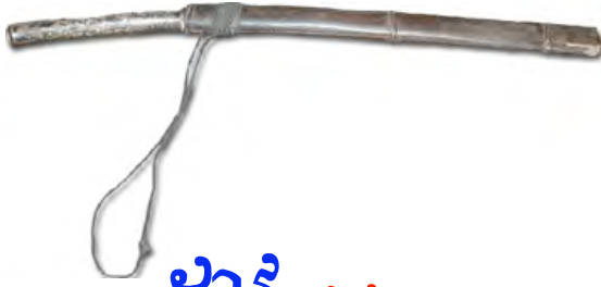
ដារី ដារី