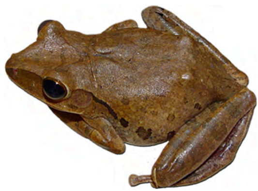
កិត កញ្ចាញ់ចេក